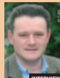
INTERVIEW NICOLAS LOTTIN CONSEILLER GÉNÉRAL