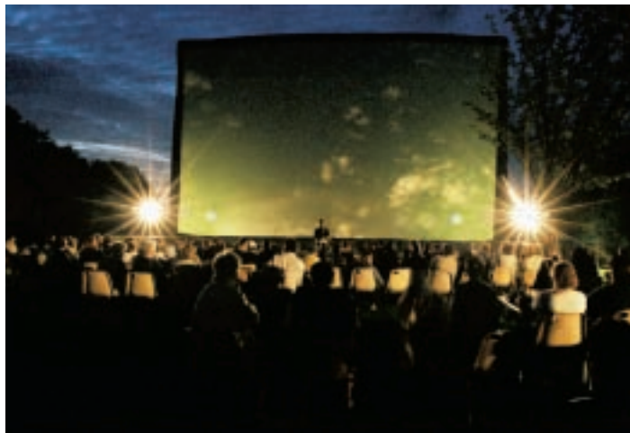
Un Été au ciné : un moment de détente et de partage dans les quartiers d'Amiens.

► Tarifs réduits, séances gratuites et en plein air, le 7 e art ne prend pas de vacances à Amiens !