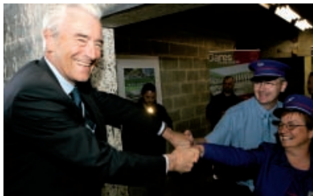
Sous la mezzanine, Gilles de Robien, accompagné de Dominique Vastel, directeur de la région SNCF d'Amiens, a symboliquement percé le mur séparant la gare de la future esplanade.

Les visiteurs étaient au rendez-vous, et même le soleil s'est invité ! Lundi 25 juin, dès 16h, les Amiénois se sont pressés pour découvrir l'avancement des travaux de l'espace Perret. De la pente douce au passage sous la mezzanine sans oublier la vue sur la tour Perret et la percée symbolique du mur séparant la place des quais : le chantier s'est laissé contempler sous toutes les coutures.