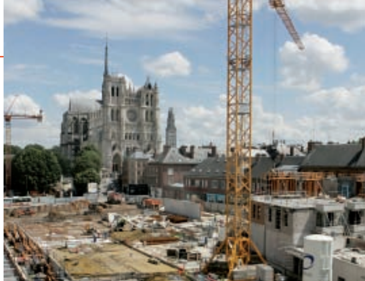
La ZAC permet de renouer avec les perspectives du passé qui valorisaient la plus ancienne église gothique classique.

Toutes les constructions sont soumises à des exigences architecturales très fortes liées à la valeur historique des lieux. La brique et la pierre sont donc privilégiées. Les pierres des marches reliant haut et bas parvis ont été déposées et stockées avec soin pour être reposées à la fin des travaux. Côté logement, la construction prévoit 11 habitations dans la zone Don-Hocquet (avec surface