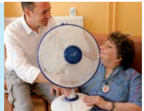
Dans le cadre du plan Prévention canicule de la Ville d'Amiens, des visites à domicile seront organisées en cas de déclenchement de l'alerte par la préfecture.

À Amiens, si tout le monde espère le soleil, la chaleur qui l'accompagne est parfois un danger. C'est pourquoi, dans la continuité de son dispositif Service Écoute Senior, la Ville d'Amiens réactive son Plan Prévention canicule et se mobilise face à l'éventualité de fortes chaleurs. Un numéro vert est à disposition pour améliorer l'écoute et l'intervention auprès des personnes les plus fragilisées, mais aussi la mobilisation et la coordination de moyens humains et matériels. En cas de déclenchement de l'alerte par le préfet, le dispositif sera étendu aux maisons de retraites et résidences