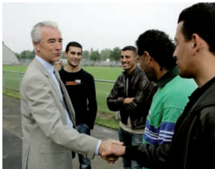
Le 11 juin, Gilles de Robien a salué les performances du club au milieu de ses joueurs et dirigeants.

► L'Athlétic Club Amiens peut arborer un large sourire: la saison qui s'achève fut exceptionnelle. Coupe de Picardie, Coupe de la Somme, maintien en CFA 2, ils ont joué gagnants sur tous les tableaux.