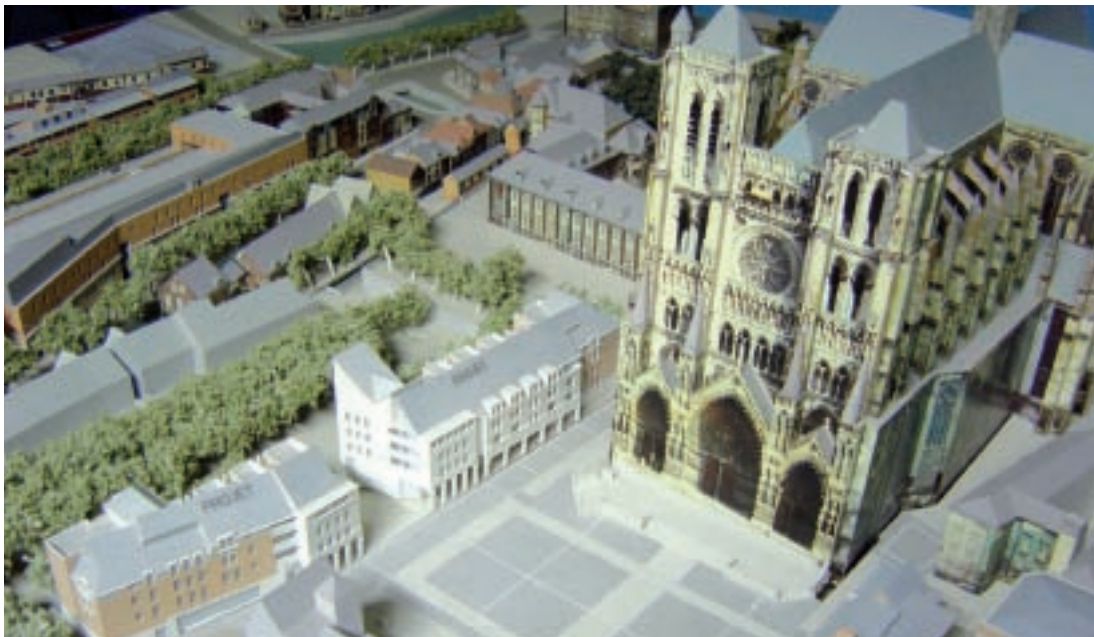
Par leur fidélité architecturale à l'esprit amiénois, les futures habitations permettront de densifier les abords de la cathédrale, de développer les commerces et l'attractivité du quartier Saint-Leu, enfin réconcilié au centre-ville.