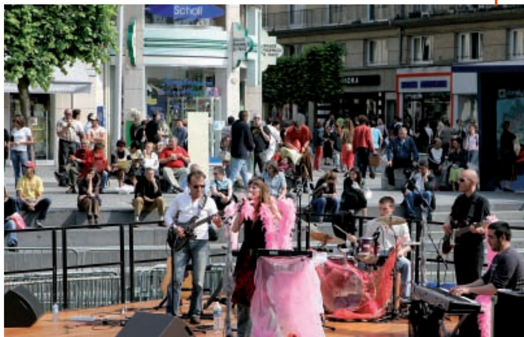
Des "Rendez-vous musicaux" au "Kiosque à musique", l'été amiénois s'égrène en chanson...

Les Bateaux de Saint-Leu Accueil : chalet face au quai Bélu 03 22 71 60 20