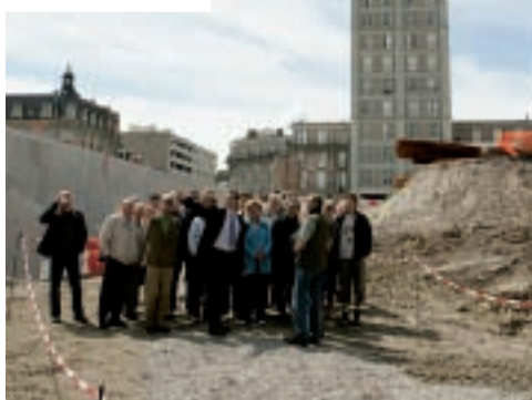
Première étape de la visite : la descenderie, plateau en pente douce qui donnera un accès de plain-pied aux quais.

▶ INFOGARE, tout ce qu'il faut savoir sur l'évolution du chantier Gare-la Vallée ◀