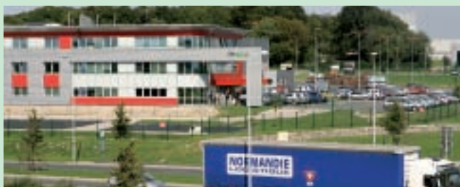
De 130 hectares, le pôle Jules-Verne va passer à 280. Un vrai succès qui attire de grands noms de l'industrie et de la distribution.

Fort de 135 entreprises et de plus de 2 000 salariés, le pôle Jules-Verne à l'est d'Amiens est en cours d'extension. Au-delà de grandes parcelles destinées à accueillir des projets d'envergure nécessitant une emprise foncière importante, l'aménagement et la commercialisation de petits lots destinés aux PME sont déjà bien avancés. En dix ans, le Pôle Jules-Verne — aménagé et commercialisé par la CCI pour le compte de la Métropole — est devenu l'un des principaux centres de l'activité commerciale, industrielle et tertiaire de la métropole. De grands noms tels que Clarins, Daw France ou Alloga Pharma s'y sont installés avant d'être rejoints par certaines administrations et des PME-PMI à fort potentiel, à l'image de Metarom France.