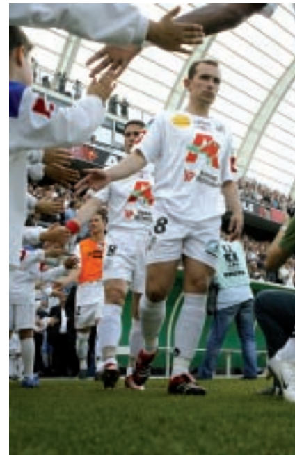
Après leur très beau parcours 2006-2007, les Amiénois accueillent Troyes, ancien pensionnaire de Ligue 1, pour le premier choc de la saison à la Licorne.

FOOTBALL : AMIENS/TROYES Stade de la Licorne (20h)