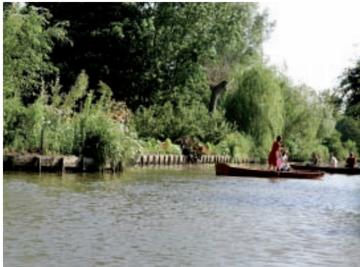
Les hortillonnages, lieu incontournable pour qui veut comprendre l'histoire amiénoise.

LIQUID Kiosque en Musique, square Jules- Bocquet (16h30)