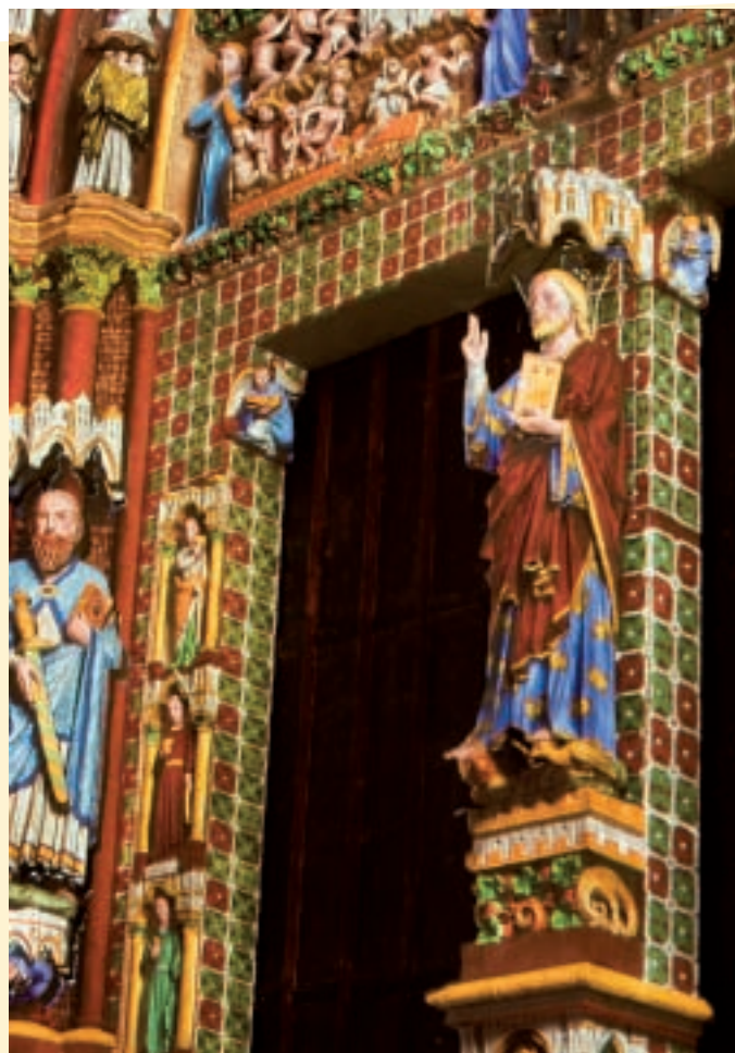
Création Skertzo pour Amiens Métropole

Proposés par Amiens Métropole, les "Rendez-vous musicaux" sont organisés chaque samedi, place Gambetta ou sur le parvis de la cathédrale en préambule au spectacle "Amiens, la cathédrale en couleurs". Ils font la part belle aux artistes amiénois, ces talents d'ici qui évoquent le lointain... Le même esprit anime le Kiosque en Musique chaque dimanche au square Jules-Bocquet en invitant notamment le chant lyrique des X-Elles qui s'approprient avec dérision un répertoire éclectique ou La Chantal et ses textes décalés, le blues de Psykophonics ou les percussions de Quasar et Requin Blindé... Des artistes tous représentatifs de la diversité musicale amiénoise, à apprécier en plein air.