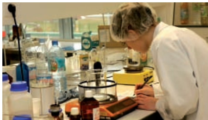
Début juillet, deux nouveaux salariés affectés à la Recherche & Développement rejoindront Métarom (118 salariés), entreprise installée depuis 2004 sur le Pôle Jules-Verne et spécialisée dans l'aromatique, les colorants et les caramels pour l'agroalimentaire.