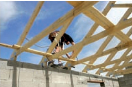
Les entreprises de BTP, filière porteuse d'emplois, n'hésitent pas à s'installer dans la métropole, à l'instar de l'entreprise nordiste Ramery, qui s'implante à Camon.

L undi 25 juin, 11h30. Pôle logistique de Poulainville. L'inauguration du Centre d'Inspection Technique des Véhicules de la Somme, spécialiste du contrôle technique des voitures et poids lourds, a une nouvelle fois