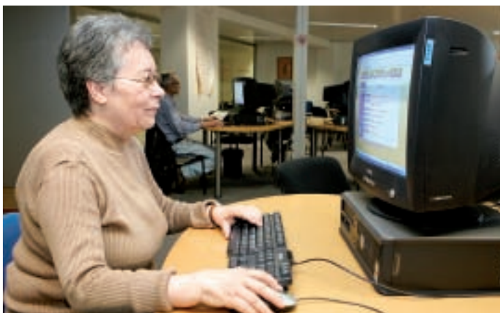
L'outil informatique intéresse tout le monde, des plus jeunes aux plus âgés. Et les logiciels libres participent largement à cette démocratisation.

Alors que Paris accueillait les 13 et 14 juin le salon du Libre, qui a drainé quelque 3 000 visiteurs, c'est au tour d'Amiens de recevoir du 10 au 14 juillet, et pour la première fois, les Rencontres Mondiales du Logiciel Libre (RMLL). En un mot, le logiciel libre, toujours livré avec son code source, donne à tout utilisateur – pour peu qu'il s'y connaisse – la possibilité de rentrer dans le programme pour voir comment il fonctionne et le modifier librement pour l'adapter à ses besoins grâce à une licence d'utilisation qui garantit une grande liberté. Liberté mais aussi gratuité (la plupart des logiciels libres le sont) qui font toute la différence par rapport au logiciel dit propriétaire*. « Prenons le cas de la bureautique : aujourd'hui, une entreprise qui achète Microsoft Office doit déboursier au moins 400 euros pour chaque poste alors qu'Open Office, son équivalent en logiciel libre, est totalement gratuit, même s'il peut y avoir des coûts de formation et de migration », explique Marc Leroy, vice-président d'EPPLUG, l'association amié-