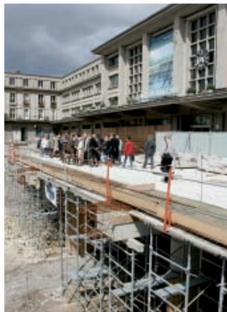
À terme, l'ancien niveau de la gare offrira une perspective imprenable sur la place, la descenderie et la tour Perret.

« Cette visite permet de s'informer et de poser des questions sur le projet mais j'attends d'être convaincu. Actuellement, mon avis est partagé. L'ancienne gare était fonctionnelle, mon opinion se précisera à l'usage. La verrière peut apporter un cachet que la place n'avait pas jusqu'ici. Cela revalorisera le quartier. Je m'interroge par contre sur les accès à la gare. J'apprécie beaucoup certaines réalisations comme le parc Saint-Pierre mais pour l'instant, je reste circonspect ».