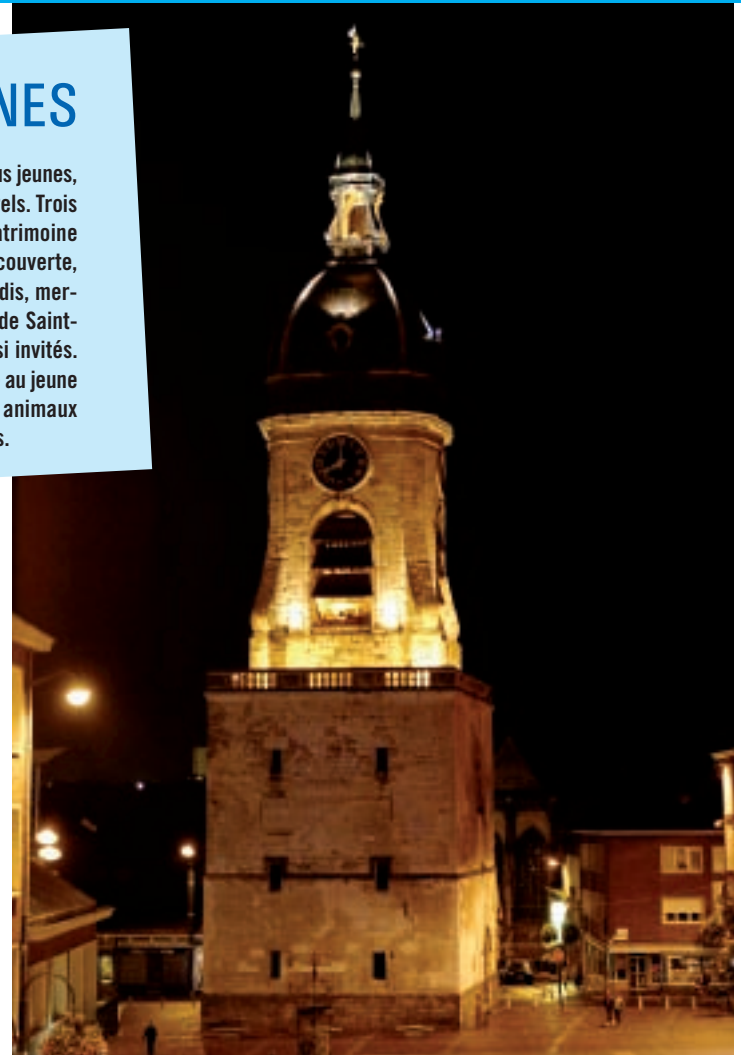
Ayant traversé six siècles mouvementés, le beffroi, "Ch' Bedouf" pour les Amiénois, abrite une histoire... À découvrir chaque vendredi soir, à 20h.