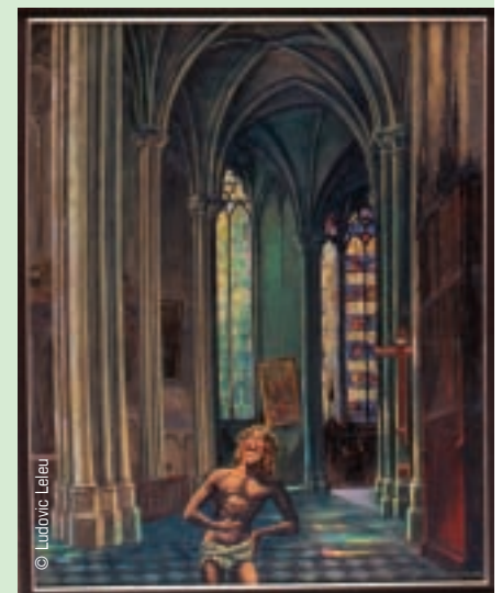
Le grand poème d'Amiens , 1907-1942, huile sur toile 100 x 81 cm, Musée de Picardie.

Jusqu'au 26 août Musée de Picardie 48, rue de la République 03 22 97 14 00